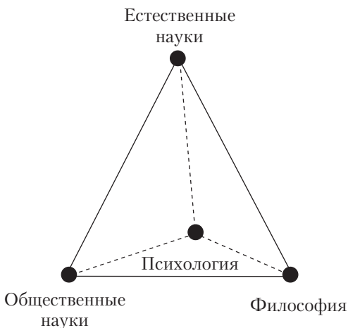
Рис. 1.1. Место психологии в системе наук (по Б. М. Кедрову)

наук и философии, образующая рисунок треугольника. Психологии в этой схеме отведено место почти в центре треугольника, но ближе к философии, поскольку есть мнение, что теорию познания построить без психологии нельзя (рис. 1.1).